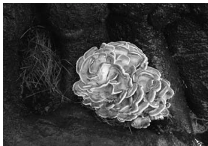
Plodnice vějířovce obrovského na kořenových náběžích slatiňanského červenolistého buku