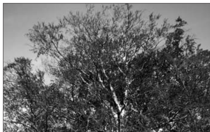
Pohled na stále výrazněji řídnoucí korunu stromu