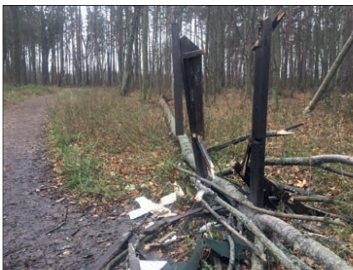
Škrovádská autobusová zastávka a u pastvin nám „pomohl“ vítr.