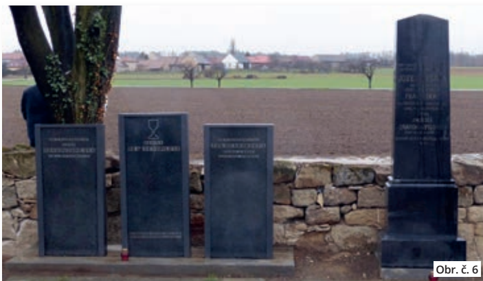
Obr. č. 6

7) Příslušníci této církve patřili k utrakvistům (kališníkům) církve evangelické, přijímající svátost oltářní podobojí, tj. chlebem i vínem. Nejbližší kostel pro bohoslužbu byl pro ně postaven až v roce 1935 ve Slatiňanech (22. 9. 1935), v Chrudimi to bylo o něco dříve, v roce 1890.