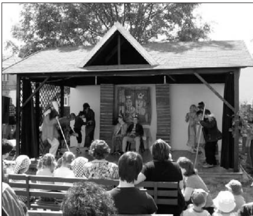
Divadelní vystoupení v altánu v rámci „Abrakova dne“

u nás a již i v zahraničí. Naprosto hlavní je však pro nás zapojení tohoto souboru a celé naší školy do kulturního dění města. Výborné výsledky v soutěžích našich žáků, zvláště v posledních letech, jen zvyšují laťku a úroveň naší činnosti pro veřejnost. Nové projekty a akce, které v posledních letech vznikly a které naše škola spoluorganizuje, jako např. podzimní mezinárodní folklórní festival Tradice Evropy, Slatiňanské pozastavení, školní akademie v divadle K. Pippicha aj., jsou pro naši školu výzvou a motivací. Velkou pomoc máme i díky