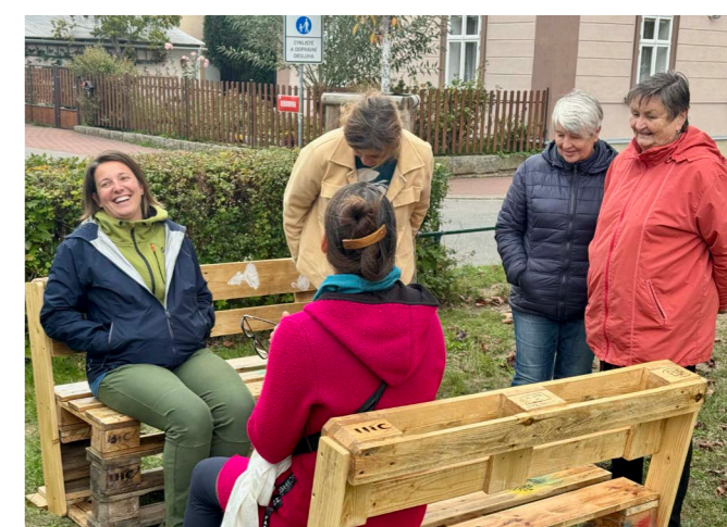
Fotodokumentace konzultačního odpoledne dne 4. října 2025