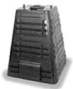
700 l (zelený, černý) nabízená cena: 1 249 Kč

Pro stálý zájem o kompostéry nabízí tímto město Slatiňany svým občanům a majitelům nemovitostí na území města Slatiňany (včetně místních částí Škrovád, Kunčí a Trpišov) k odkoupení za zvýhodněné ceny platné pro rok 2009 tyto kompostéry: