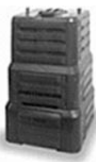
390 l (zelený, černý) nabízená cena: 544 Kč