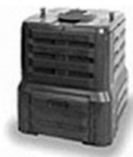
290 l (zelený, černý) nabízená cena: 451 Kč