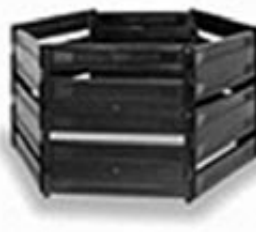
650 l (černý) nabízená cena: 470 Kč