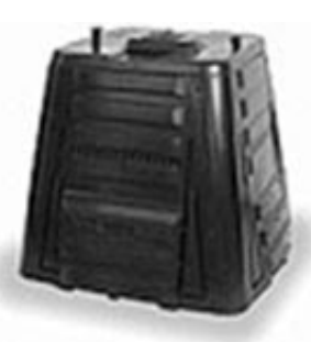
350 l (černý) nabízená cena: 461 Kč