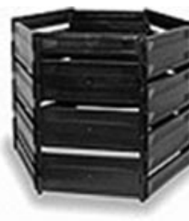
900 l (černý) nabízená cena: 569 Kč

Nabízené ceny tvoří 50% pořizovacích nákladů. Tyto pořizovací náklady jsou navíc výrobcem kompostérů pro obce a města zvýhodněny. Běžné ceny můžete najít na webových stránkách výrobce, a to www.kompostery.cz .