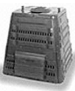
400 l (zelený, černý) nabízená cena: 773 Kč