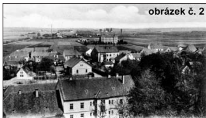
obrázek č. 2

– 6. března oznámil vytesání nápisu Den svobody na kameni