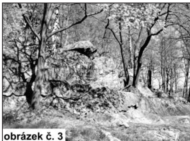
obrázek č. 3

u mariánského sloupu v obecní třešňovce a zabudování 3 laviček.