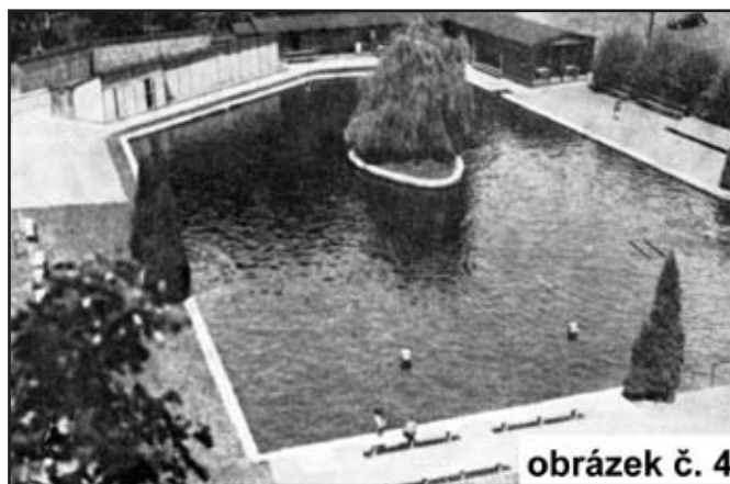
obrázek č. 4

1926 – Za účelem odhalení pamětní desky J. Vrchlickému na návrší třešňového sadu (2. Května) se spolek podílel na terénní úpravě daného prostoru, k čemuž vznikl pracovní tým tzv. Odbor pro úpravu návrší. Současný stav vidíme na obr. 3.