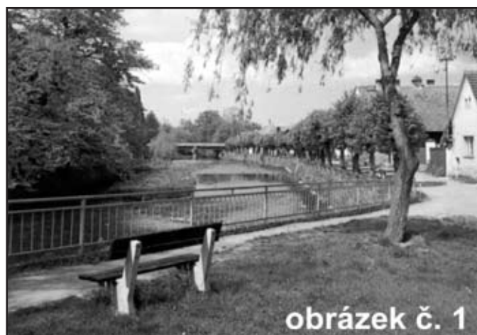
obrázek č. 1

Připomenut je i okrašlovací spolek, obětavě se angažující na zvelebění, čistotě a péči o veřejnou zeleň obce již po několik desetiletí.