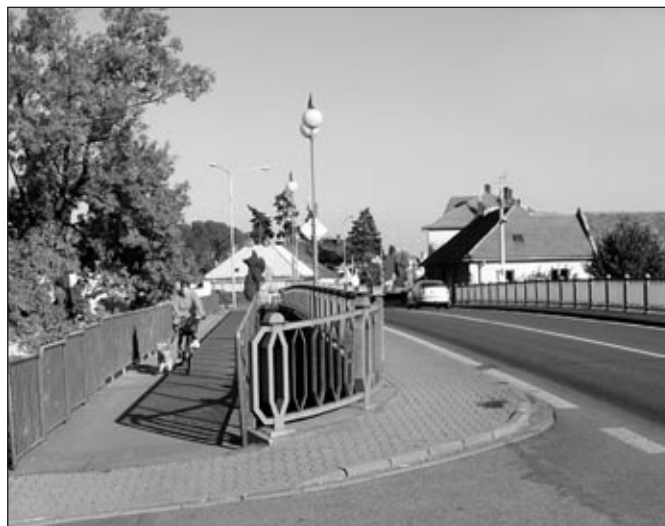
Paralelní lávka pro pěší z roku 1987