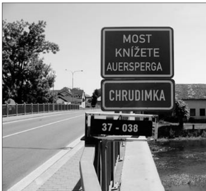
Most s novým označením

Zastupitelstvo města na svém zasedání 14. 12. 2010 odsouhlasilo pojmenování této technické stavby na „Most knížete Auersperga“ a most byl 17. 6. 2011 opatřen cedulkou s tímto názvem.