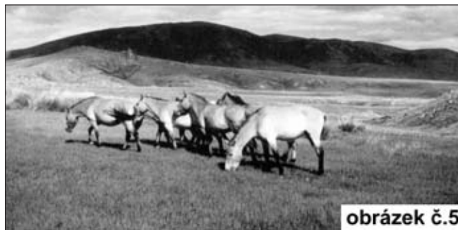
Typická polostep v Mongolsku s malým stádem koní při pastvě