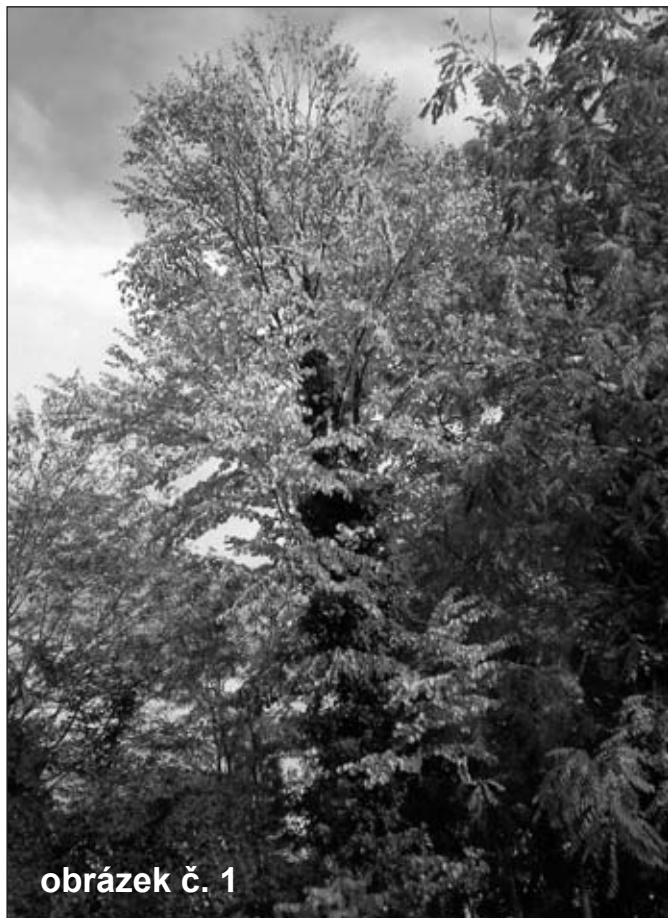
obrázek č. 1

Ve slatiňanském arboretu stojí za pozornost například zmarličník japonský ( Cercidiphyllum japonicum ) – obr. č.1, toreja kaliforn-