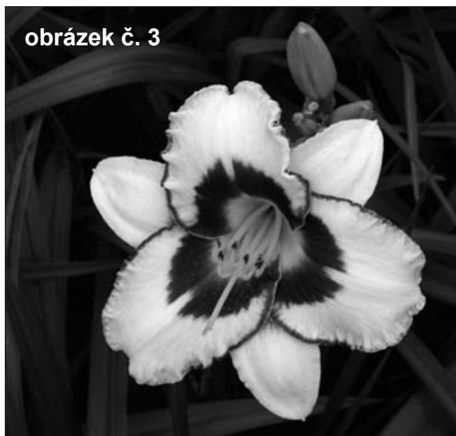
obrázek č. 3

novými výsadbami nechybí ani historické, botanické či anglické růže. Z botanických jmenujme například růži Hugovu ( Rosa hugonis ) či růži Moyesovu ( Rosa moyesii ). Ty anglické jsou reprezentovány jak jinak než kultivary proslulého Davida Austina. Slatiňanské arboretum je nejen sbírkou dřevin, ale doplňuje ji i sbírka trvalek – denivek. Ta již nyní čítá desítky kultivarů těchto rostlin s květy různých barev tvarů i velikostí – obr. č. 3 a obr. č. 4. Jak místní, tak i turisté mohli letos navštívit arboretum v rámci komentovaných exkurzí. Těch se během roku konalo celkem sedm (financoval je Pardubický kraj). Každá z nich zavedla účastníky nejen do zámeckého parku, ale právě i do nového zámeckého arboreta (nechyběla ani symbolická výsadba dřevina trvalek). Nové