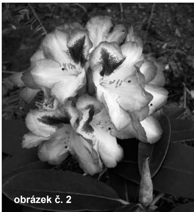
obrázek č. 2

ská ( Torreya californica ), mahónie Bealova ( Mahonia bealei ), nahovětvec dvoudomý ( Gymnocladus dioica ) nebo unikátní javor habrolistý ( Acer carpinifolium ). Nově byla vysazena pestrá škála kultivarů pěnišníků a azalek – za všechny lze zmínit velmi krásný kultivar pěnišníku 'Hachmann's Charmant' – obr. č. 2. Mezi