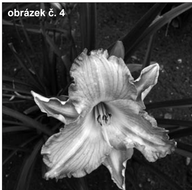
obrázek č. 4

novými výsadbami nechybí ani historické, botanické či anglické růže. Z botanických jmenujme například růži Hugovu ( Rosa hugonis ) či růži Moyesovu ( Rosa moyesii ). Ty anglické jsou reprezentovány jak jinak než kultivary proslulého Davida Austina. Slatiňanské arboretum je nejen sbírkou dřevin, ale doplňuje ji i sbírka trvalek – denivek. Ta již nyní čítá desítky kultivarů těchto rostlin s květy různých barev tvarů i velikostí – obr. č. 3 a obr. č. 4. Jak místní, tak i turisté mohli letos navštívit arboretum v rámci komentovaných exkurzí. Těch se během roku konalo celkem sedm (financoval je Pardubický kraj). Každá z nich zavedla účastníky nejen do zámeckého parku, ale právě i do nového zámeckého arboreta (nechyběla ani symbolická výsadba dřevina trvalek). Nové