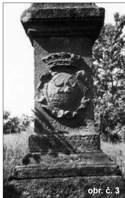
obr. č. 3

Pardubický sochař Karel Krátký se bude v letošním roce zabývat restaurací obou pomníčků. Při ohledání a posouzení jejich technického stavu pouze konstatoval havarijní stav. Ten má hlavně na svědomí zub času a bohužel též lidská hamižnost a vandalství. Musí se proto na místě rozebrat a odvézt do ateliéru k opravě poškozených míst a petrifikaci k zamezení rozpadu pískovce. Počítá se také s výmě-