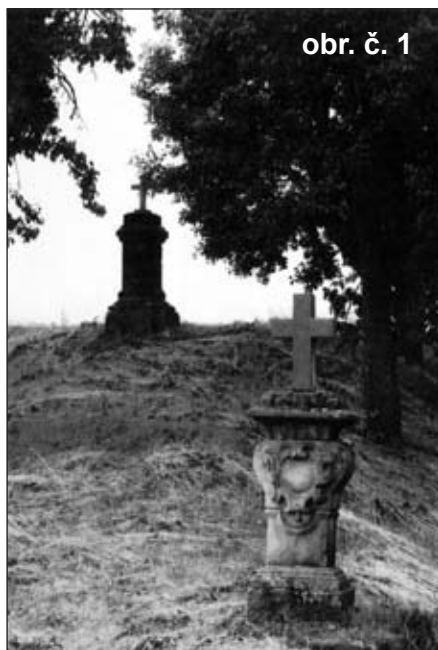
obr. č. 1

Zajímavá je ještě hlavice sloupu, která je usazená na rozšířeném podstavci se zmíněnou kartuší, ve spodní části kanelurou zvýrazněnou a tvarovanou do obloučku, na níž jsou umístěny oblé kameny, dovedně vytesané z pískovcového bloku. V křesťanské symbolice představují skalnatý vrch Golgoty u Jeruzaléma, na jejímž temeni byl podle biblického podání ukřižován Ježíš Kristus.