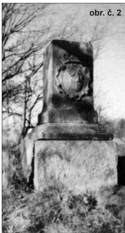
obr. č. 2

Podle zápisu ve farní kronice z roku 1836 šlo o důstojníka šlechtice v hodnosti kapitána, působícího v královských službách. Podle zjištění ředitele chrudimského archivu byl dislokován v Uhrách a za vlády císařovny Marie Terezie se účastnil četných střetů s nepřítelem. Zápis z kroniky byl přetištěn do Ozvěn (prosinec 2011) a více by k tomu dodal vojenský historik a vyjádřil se k označení jednotky v níž sloužil (jízda, pěší vojsko atd.), které je zašifrováno. Přední strana podstavce má také reliéfní kartuš s vypouklým kruhovým štítem, nahoře uzavřeném šlech-