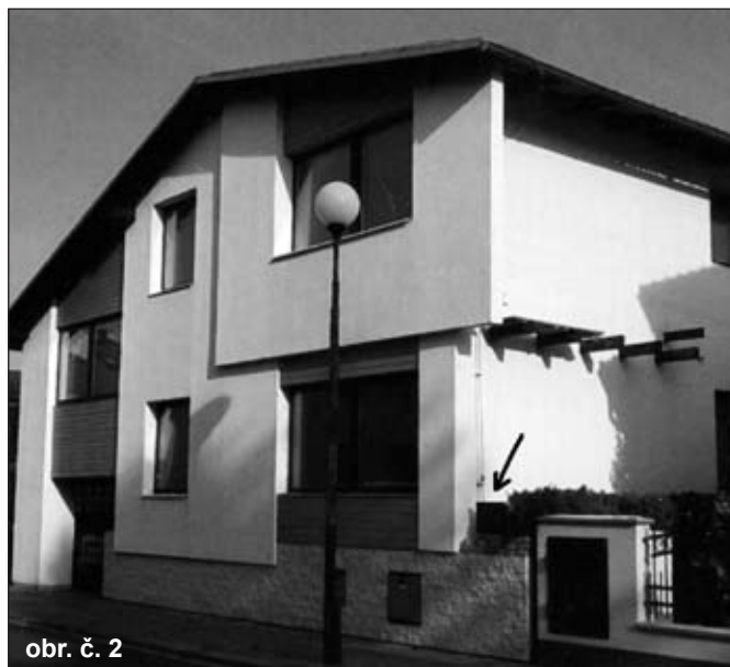
obr. č. 2