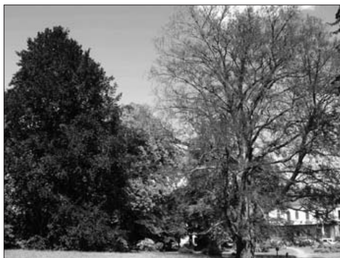
Srovnání stavu olistění z léta 2013. Dva červenolisté buky vedle sebe – vlevo je stav zdravého červenolistého buku a vpravo je na první pohled viditelné radikální proschnutí koruny až z 80%, přičemž západní polovina stromu byla již suchá úplně.

Na základě těchto překvapivých a nemilých výsledků bylo na den 7. 12. 2012 svoláno jednání zástupců zainteresovaných institucí, a to Městského úřadu Chrudim, Odboru životního prostředí, Krajského úřadu Pardubického kraje, ústředního pracoviště Národního památkového ústavu, Agentury ochrany přírody a krajiny ČR a Správy CHKO Železné hory. Jednání se zúčastnil také arborista. Přítomní na tomto jednání projednali obě možné varianty, tedy pokácení nebo ponechání na dožití s radikálním seříznutím koruny. Byl vysloven nesouhlas s provedením razantního redukčního řezu, který by z důvodu bezpečnosti musel také zahrnovat výstavbu oplocení kolem stromu, aby byla zajištěna bezpečnost návštěvníků, což by s sebou přineslo vysokou finanční nákladnost a estetické znehodnocení místa. Z tohoto důvodu bylo dne 22. 4. 2013 vydáno rozhodnutí Městského úřadu Chrudim, Odboru životního prostředí, které zrušilo ochranu památného stromu. Rozhodnutí nabylo právní moci dne 10. 5. 2013.