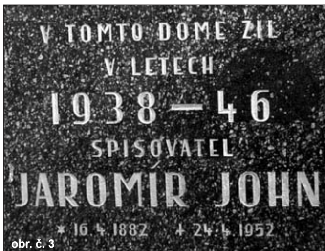
obr. č. 3

Ke cti vůdčí postavy je třeba říci, že on sám nebyl vinen. Ta vězela v obžalobě životního stylu společenské vrstvy, typické pro morálku měšťáků, k níž on a nevěrná Viki patřili.