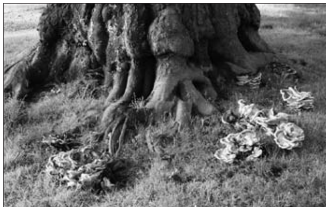
Plodnice vějířovce obrovského u báze kmene (plodnice jsou jen nadzemní částí houby, která napadá kořenový systém, díky plodnicím se pomocí výtrusů šíří dále).