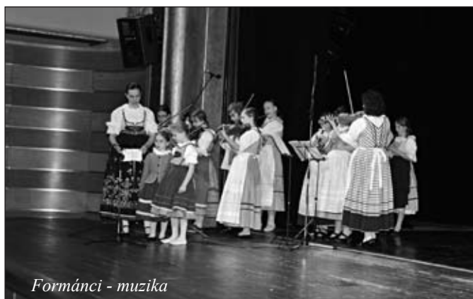
Formánci - muzika