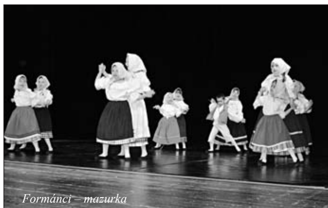
Formánci – mazurka