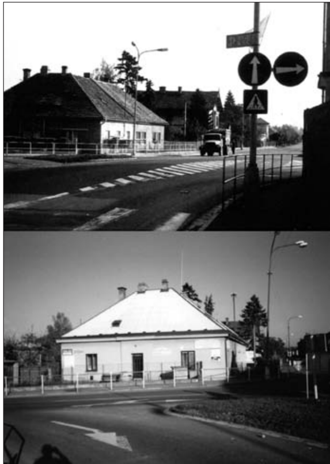
V textu zmiňovaný Schmoranzův domek má č.p. 21 a nachází se na hlavní křižovatce.

Ing. Milan Vorel