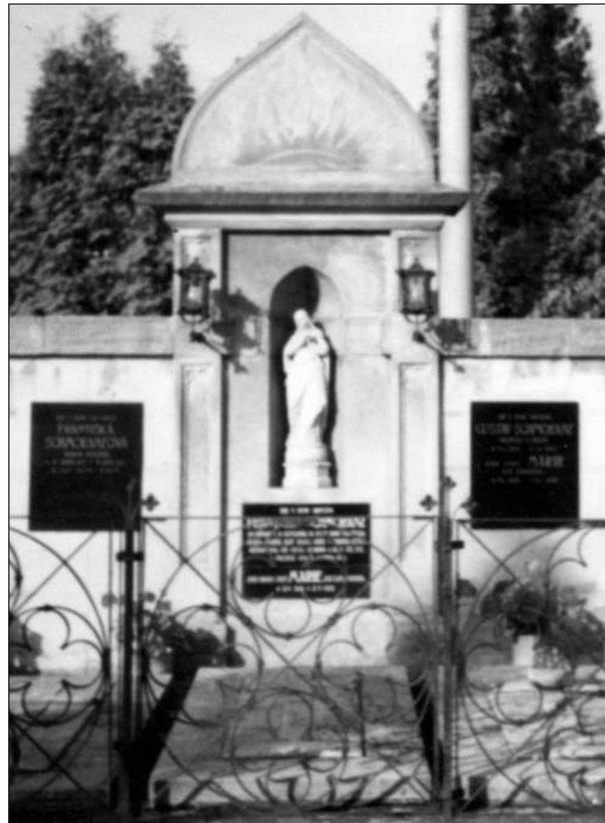
Střední část oploceného pole s náhrobky rodiny Schmoranzů na místním hřbitově. Nápis o zemřelém se sochou ve výklenku čelní náhrobní desky patří F. Schmoranzovi.