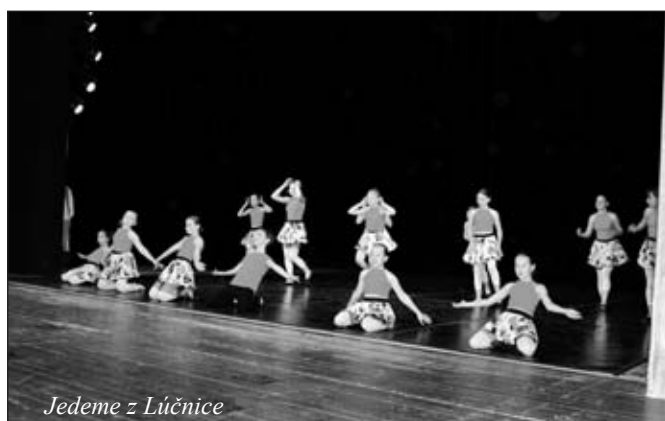
Jedeme z Lúčnice