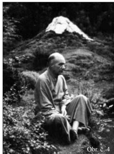
Obr. č. 4

O japonské zahradě v zámeckém parku situované vedle ateliéru malíře refe-