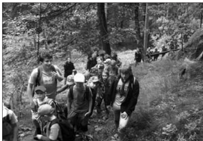
Vlčata a světlušky v Českém ráji