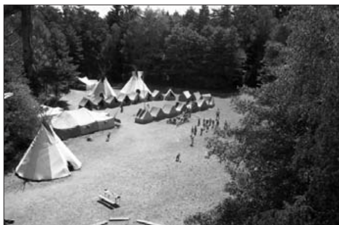
Tábor kluků v Toulovcových Maštalích 2014