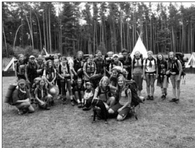
Dívčí tábor Břehy u Přelouče

V září jsme zrealizovali okresní setkání vlčat a světlušek v Šiškovcích. Dopoledne připravily jednotlivé oddíly své disciplíny a aktivity pro ostatní, odpoledne proběhla velká lesní hra.