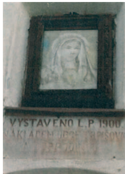
Nápis na vchodovém portálu kaple