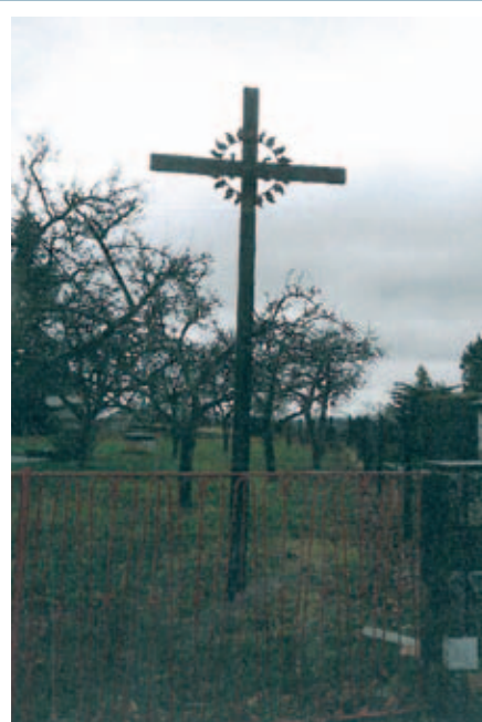
Kříž na zahradě rodiny Doležalových