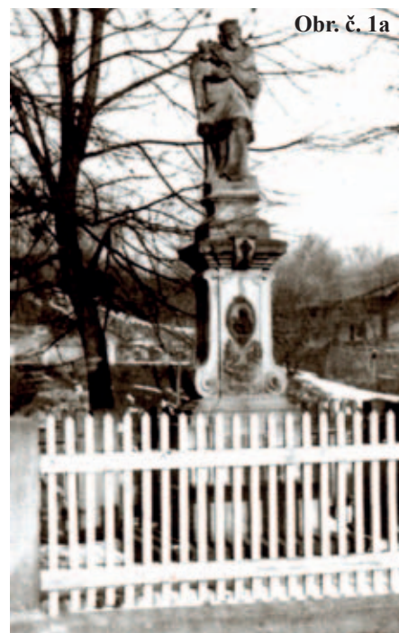
Obr. č. 1a

Na fotu č. 5 jsou zachyceny bývalé pískovcové lomy z počátku 20. století, v pozadí je obec.