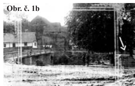
Obr. č. 1b

Autor článku v Novinách Chrudimská 22. 6. 1994 uvedl, že před přiznáním uvedeného statutu ji mělo předcházet konzervační ošetření, které socha od poslední obnovy v roce 1871 velmi naléhavě potřebovala, což bylo očividně zřejmé z příložené fotografie u novinového článku.