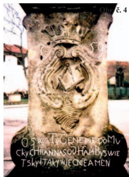
Obr. č. 4

který se pak začíná rozpadat. Je to právě zejména vlhkost, zdola vzlihané vody z pískovcového fundamentu, spady prachu z exhalací lokálních topenišť, uchycená mikroflóra v pórech atd. Pozorovaná větší poškození skulptury nastala již po odlo-