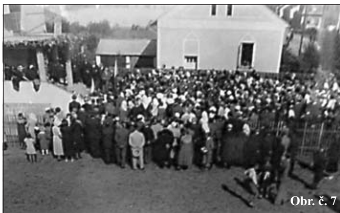
Obr. č. 7