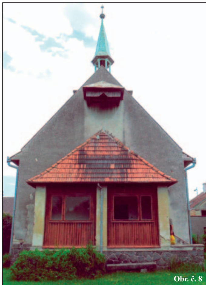
Obr. č. 8

Oddělení komunikace a vnějších vztahů Komenského náměstí 125, Pardubice Tel. 466 0269 626–8