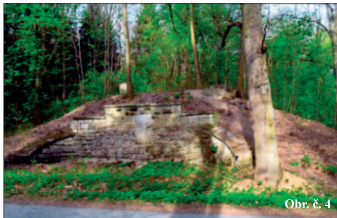
Obr. č. 4

Zdrojem vody byla široká a krytá studna, umístěná u spodního malého rybníku, situovaném u mostu silnice mezi Smrkovým Týncem a Licibořicemi, nad nímž byly ještě dva větší spolu tvořící kaskádu, označené na mapě jako Záušní rybníky. Studna byla