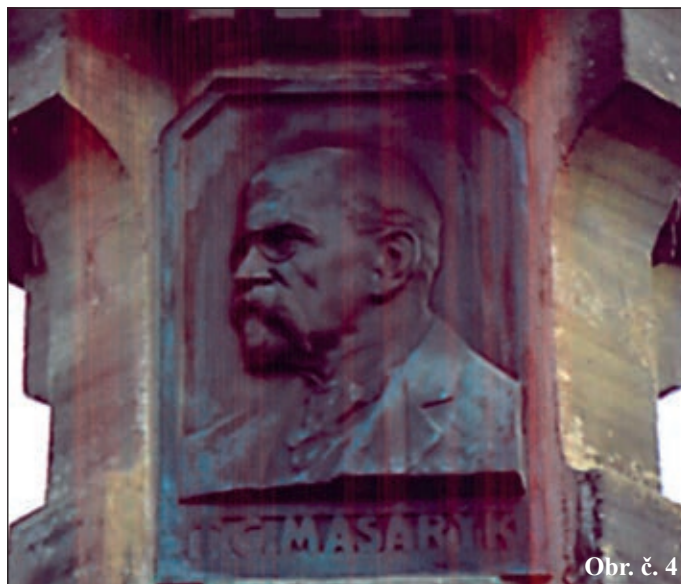
Obr. č. 4

V minulém století se nám podařilo sametovou revolucí překlenout přes nedemokratický systém jedné vládnoucí politické strany, za níž jméno Masaryka muselo být vymazáno z názvů ulic, jeho sochy a busty byly odstraněny, pamětní desky připomínající tohoto prezidenta nebo I. republiku sejmuty nebo rozbity.