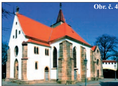
Obr. č. 4

zahájen v kapli kláštera modlitbou růžence, poté mší a první misijní promluvou. Každý následující den byl věnován jednomu z misijních témat, jak poznamenal do kroniky farář Bohuslav Směšný, například o víře, obrácení či rozjímání nad utrpením, ale i štěstím v lidském pokolení.