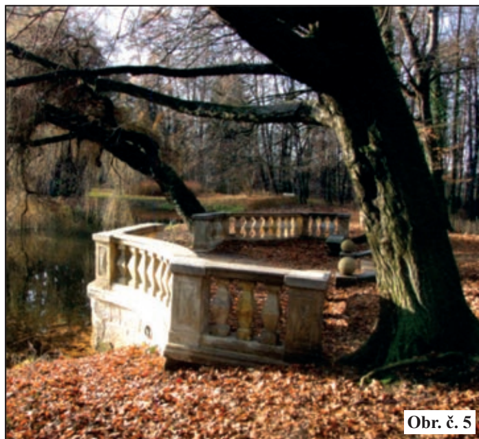
Obr. č. 5

Za dob kastelánky R. Horákové byl uzavřený park přístupný denně, čas pobytu v něm byl vymezen návštěvním řádem. Ten byl umístěn na vstupní bráně poblíž buku červenolistého, památného stromu, jehož kořenový systém byl později napaden agresivní houbou a rychle pokácen (30. 1. 2014). Jeho plné olistění vidíme za sochou koně na obr. č. 4.