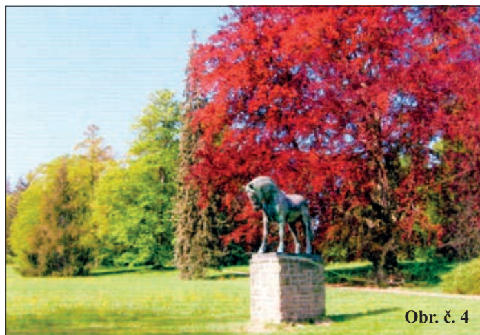
Obr. č. 4

Stav porostů a chování návštěvníků kastelánka často kontrolovala, zejména po roce 1980, v němž byla obnovena vodní hladina v jezírku, napuštěném po opětovném zprovoznění Ferdinandova vodovodu, který původně zásoboval zámek i hřebčín.