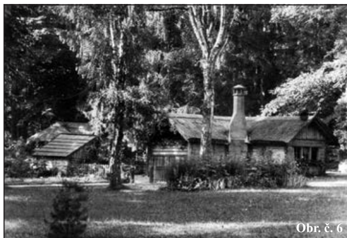
Obr. č. 6