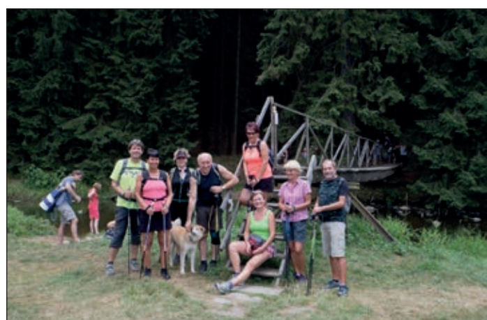
Zdravý den s NW – v červenci jsme obešli vodní nádrž Seč – foto z lávky na přítoku a Seč z Ohebu