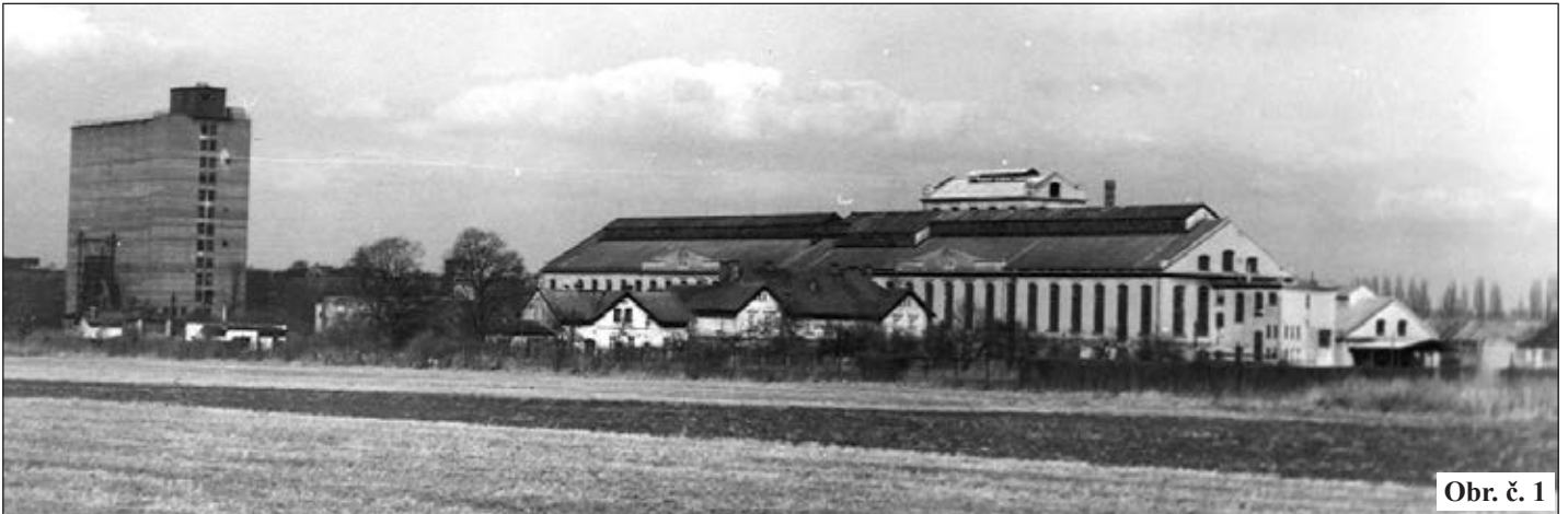
Obr. č. 1

O historii dnes již zrušeného cukrovaru situovaného v extravilánu města byly autorem napsány dva články do CHVL (Chrudimské vlastivědné listy) č. 1 a 2 z roku 1999. Vyjímáme z nich zajímavé informace, mapující průběh 110 let trvání závodu (obr. č 1 a 2).