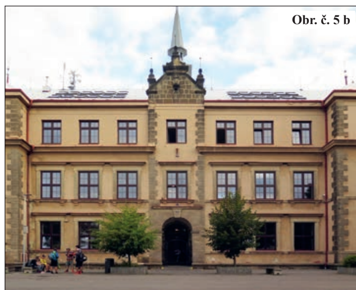
Obr. č. 5 b