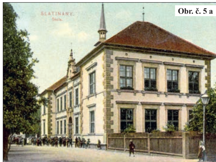
Obr. č. 5 a

hluboce zasáhl. Starosta obce J. Holub tlumočil svoji účast pozůstalým a nechal vytisknout smuteční oznámení (obr. č. 6). Příčinou smrti podle chorobopisu byl zápal plic a pohrudnice. K lůžku nemocného byl přivolán i prof. Thomayer z Prahy.