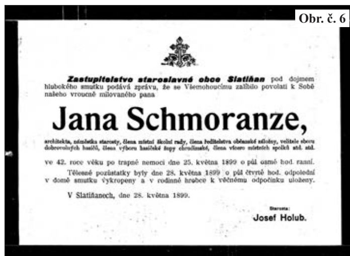
Obr. č. 6