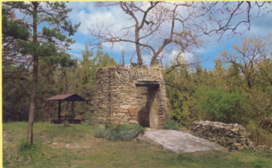
Vyhlídka Chlum 391 m n.m.