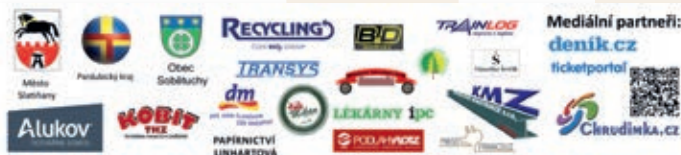
Seznam sponzorů DS Acord