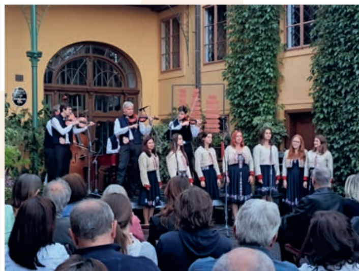
Koncert na zámku