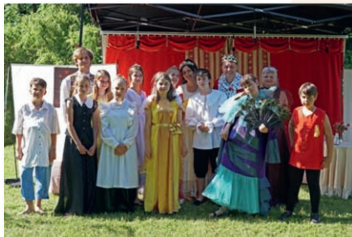
Herci po odehrání pohádky

Za vše, co se zatím podařilo, jsem vděčná a považuji to za malý zázrak. Uvidíme, jak a co se bude dařit dál. Od září nastupuji na částečný úvazek jako učitelka do ZUŠ Chrudim. V aktivitách Acordu bych chtěla dál pokračovat, ovšem tak, jak to umožní časové možnosti. V září máme v plánu hrát na zámku pro veřejnost