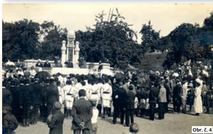
Obr. č. 4

kovovému osazení tohoto oplocení, k němuž však nelze mít žádných výhrad (obr. č. 1).