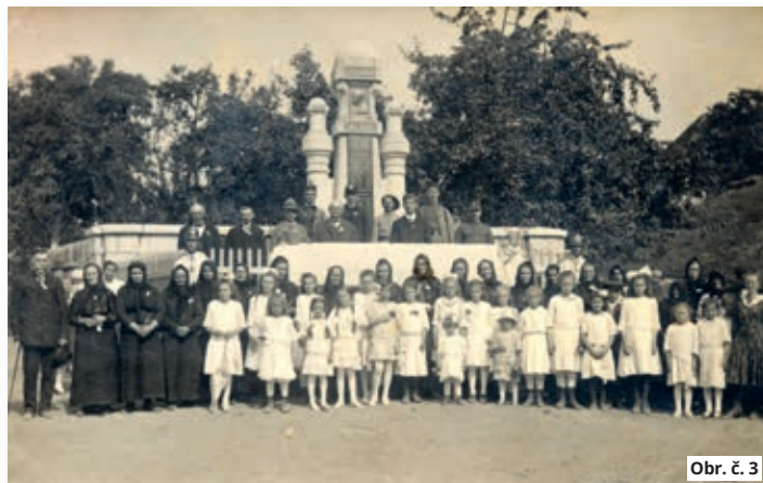
Obr. č. 3