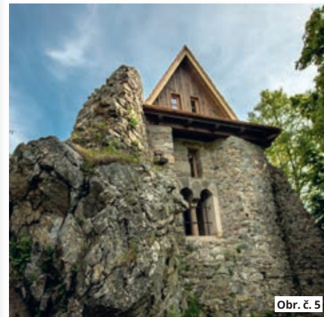
Obr. č. 5

v loňském roce. Zadní část se štítem je zachycena na obr. č. 5.