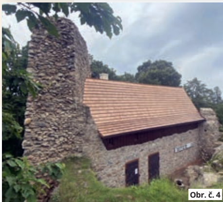
Obr. č. 4

v loňském roce. Zadní část se štítem je zachycena na obr. č. 5.