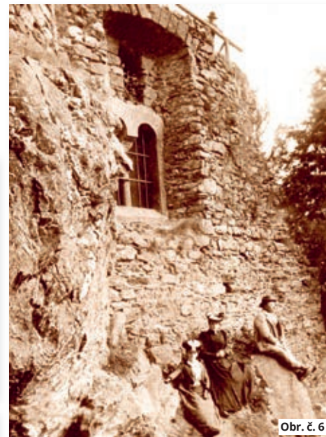
Obr. č. 6

O současný stav hradu bude zvýšený zájem nejen od turistů, putujících dále do nitra Železných hor. Po několika stoletích se opět představí ve stavu, když byl panským sídlem, přirozeně obrazně.