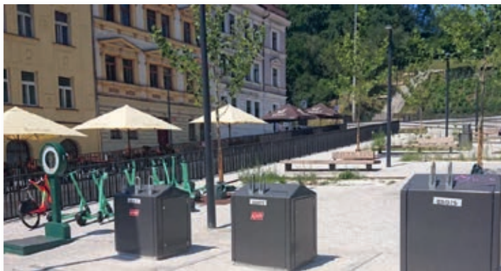
Nově rekonstruované Tachovské náměstí

Koncem června jsem byl po delší době opět v Praze a byl jsem mile překvapen neskutečně vkusnými rekonstrukcemi ulic.