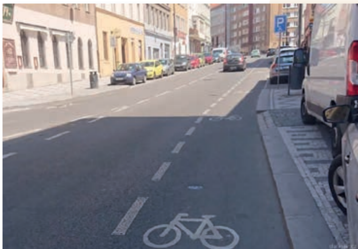
Cyklopruh v Husitské ulici

Slatiňany jsou pro dopravu na kole ještě vhodnější, ale paradoxně to na silnicích není vůbec poznat. Příkladem může být hlavní dopravní tepna v severojižním směru – TGM. Současná šíře jízdních pruhů řidiče přímo vybízí k rychlé jízdě a přítomnost cyklisty mu v tom často nezabrání. Cyklista přitom nemůže jet bezpečně těsně vedle řady parkujících aut, kdyby někdo otevřel dveře nebo zpoza nich vyšel. U této ulice se sice už roky plánuje revitalizace, která ale bude, jestli bude, až za mnoho let. Proto se zde nabízí do té doby vyznačit alespoň cyklopruhy, jako jsou třeba v Praze na Plzeňské nebo v Husitské ulici, či v Chrudimi na Pardubické.