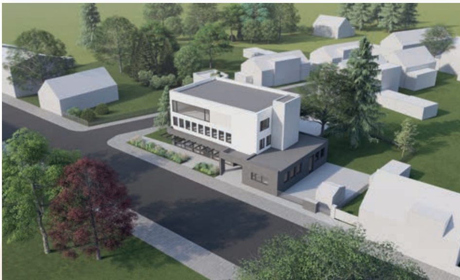
Vizualizace nástavby ZUŠ (budova bývalé spořitelny), architekt Lukáš Pavlík

konstrukce je naplánována na období červen až září 2025, kdy je objekt nejméně využíván. Během této fáze dojde k celkové modernizaci vnitřních prostor, která zahrnuje výměnu elektrických rozvodů, rozvodů vody a odpadů. Stará dřevěná okna budou nahrazena novými a celé sociální zařízení projde kompletní renovací. Odhadované náklady na tuto etapu rekonstrukce činí přibližně 3,5 milionu Kč.