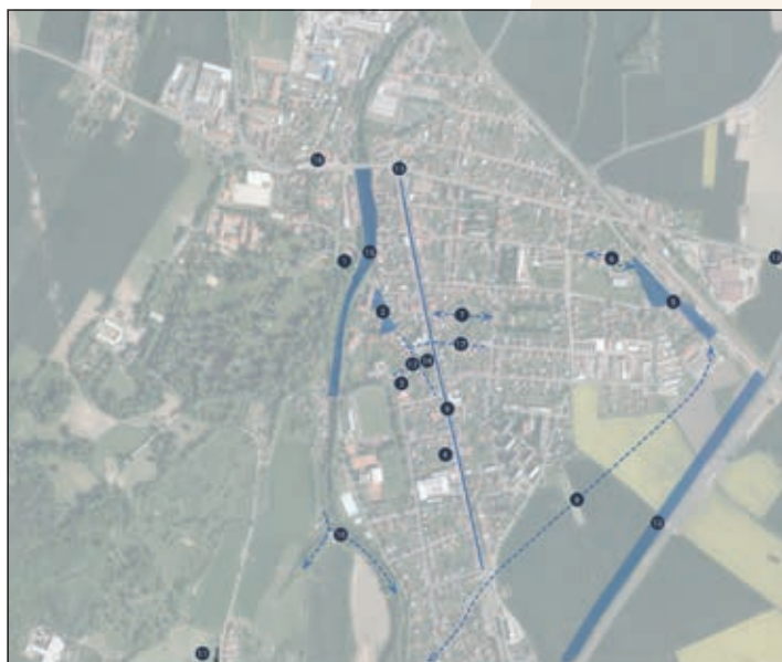
Ukázka z mapy zaznamenaných potřeb.

Výstupy z analýzy a další informace jsou dostupné na: https://www.slatinany.cz/rozvoj-centra .