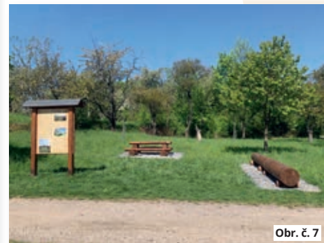
Obr. č. 7

Z dalších informací chybí příznivý osud salaše Švýcůrny, která byla přestavována z ruiny v roce 2012 a je v ní umístěno interaktivní muzeum nyní s novou expozicí (obr. č. 6).