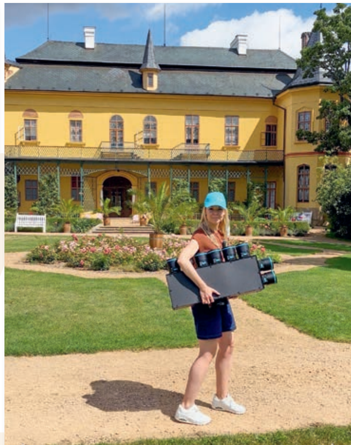
Pozvánka na veletrh s vítězným exponátem se natáčela ve slatiňanském zámeckém parku.

Společnost Luftuj s.r.o. úspěšně exportuje své výrobky, včetně svítících vyústek pro vzduchotechniku, do 18 evropských zemí. Firma se pravidelně prezentuje na mezinárodních veletrzích v zahraničí, přednáší na odborných konferencích a s hrdostí propaguje Slatiňany tím, že veškerá svá prezentační videa natáčí v krásném okolí svého sídla.